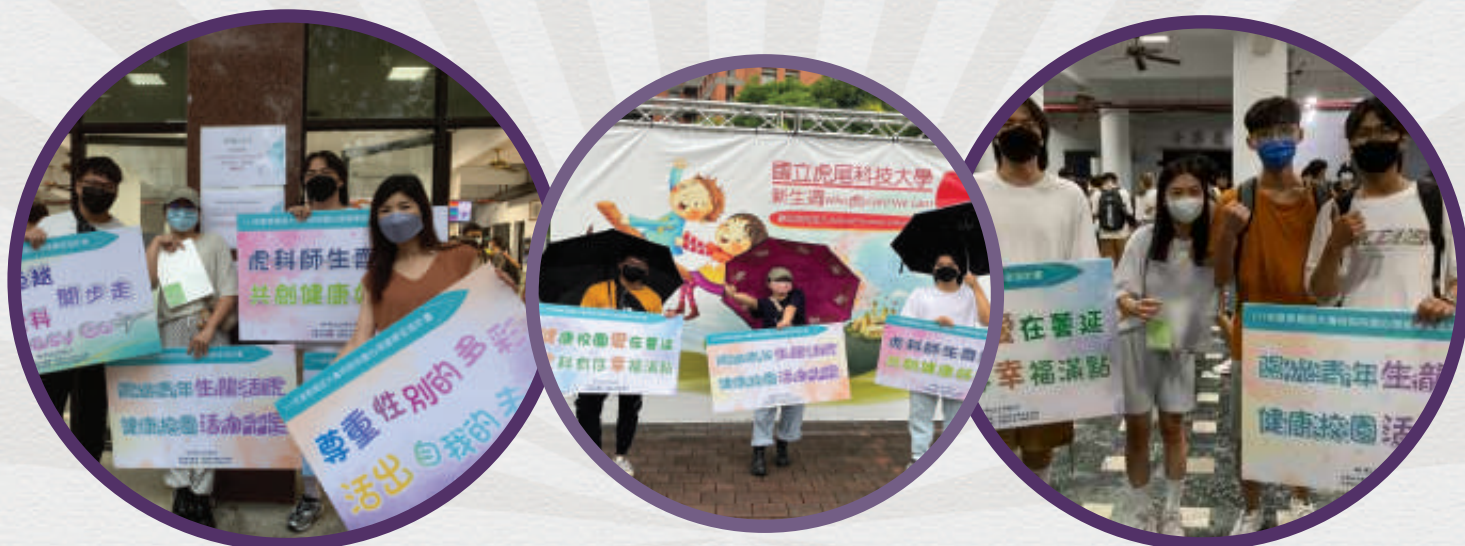
▶ 師生共創校園健康氛圍