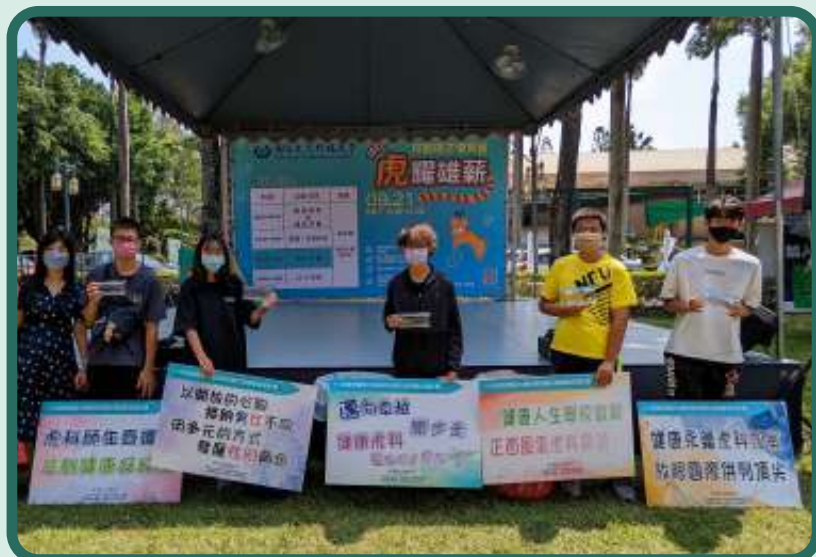
▶ 於校園徵才博覽會舞台前宣傳活動