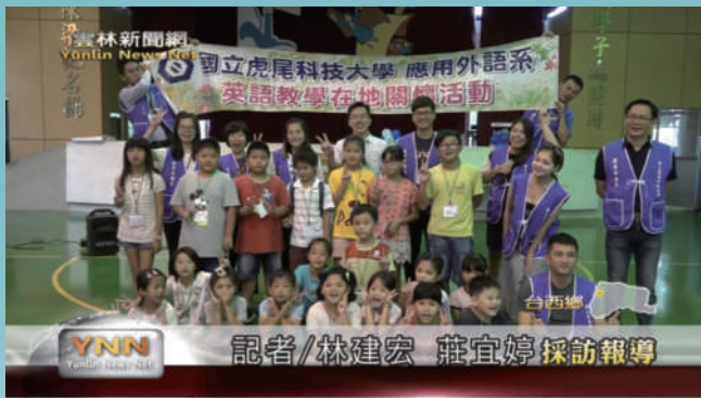
▲ 台西國小英語教學在地關懷活動。

應外系英語教學活動已經實行數年，主要是想透過英語營活動讓偏鄉小學的學生享有英語教學資源同時無壓力的學習英文，並且在學生心中種下一顆喜歡學習英文的種子。英語營輕鬆以及具有教學性質的方式透過雲林地方相聞網的報導已被其他學校所知悉，目前英語營活動已預約到明年暑假由崙背大有國小以及台西泉州小學所預訂。