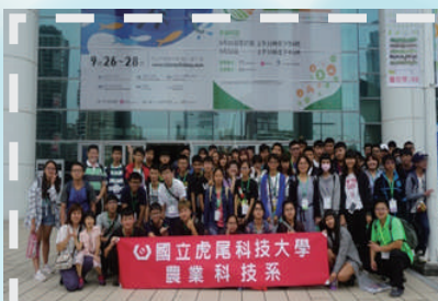
▲ 三天兩夜宿營活動。