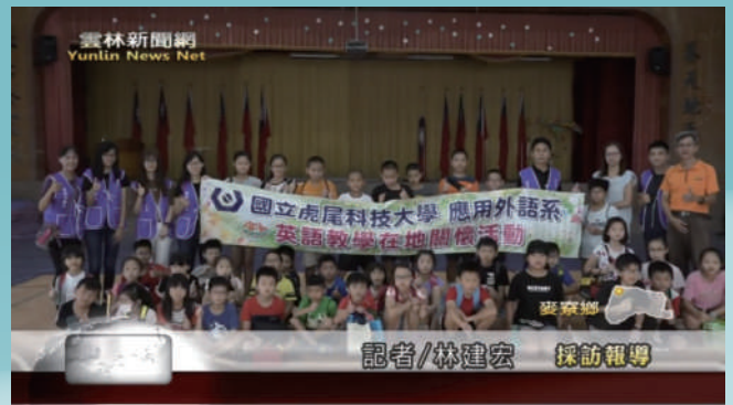
▲ 橋頭國小英語教學在地關懷活動。